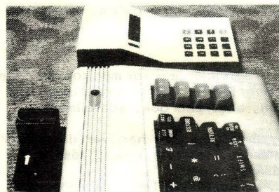
adatátvitel, párhuzamos adapterrel