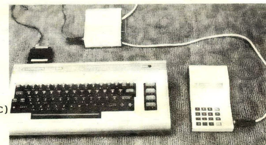
adatátvitel, V24. (RS232C) soros vonalon