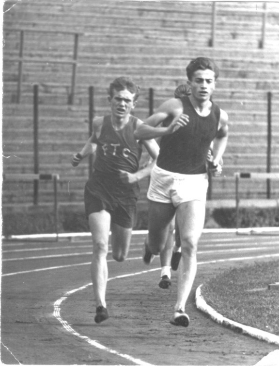
39. VERSENY KÖZBEN

megyeri úti stadionban már az első nap megtetszett, hogy csupa nagymenő sportolóval találkozom és felcsigázott, hátha nekem is sikerülne hozzájuk hasonlónak válni. Maradtam és a szorgalom elkezdett eredményeket hozni.