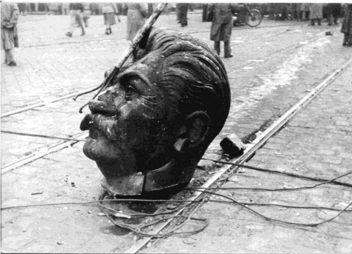
30. NÉPÍTÉLET, SZTÁLIN FEJE

Másodikosok voltunk '56-ban, 16. évesek – felnőttnek számító korosztály. Október huszonharmadikán az iskolából jövet – a Rákóczi úton – megálltak a villamosok, a Színművészeti Főiskolába hívtak valamiféle gyűlésre. Felvonulókkal találkoztunk, akik a Rádió Bródy Sándor-utcai épületéhez vonultak.