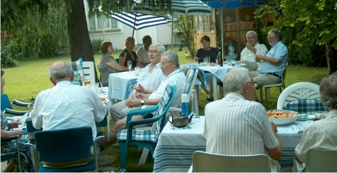
99. SZENTENDREI HÁZ: SZALON BULI

A Szentendréről civil mozgalom is jelentősnek találta szervezkedésemet és felkértek a polgármester-jelöltségre, amit természetesen nem vállaltam, mivel a politikai szerepléstől mindig távol tartottam magam. Legutóbb végre ők nyerték a választást és ma ez a mozgalom vezeti a várost. Őszintén remélem, képesek lesznek felszámolni a többéves tespedést és ismét virágzó, élhető művészcivárossá tenni.